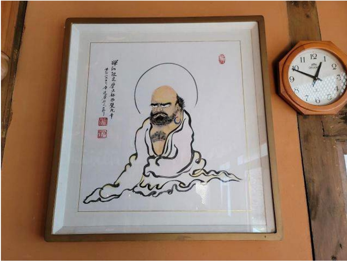
극락보전에 걸려 있는 원행의 달마도.

노천법당으로 오르는 비탈에는 사람 키와 비슷한 오죽(烏竹) 숲이 있다. 오죽은 줄기가 검어서 조경용으로 식재한다. 원행 스님이 오죽 근경(根莖)을 구해다 심으면서 검은 대나무가 작은 숲을 이루었다. 동굴법당으로 오르는 언덕에는 조릿대가 자란다.