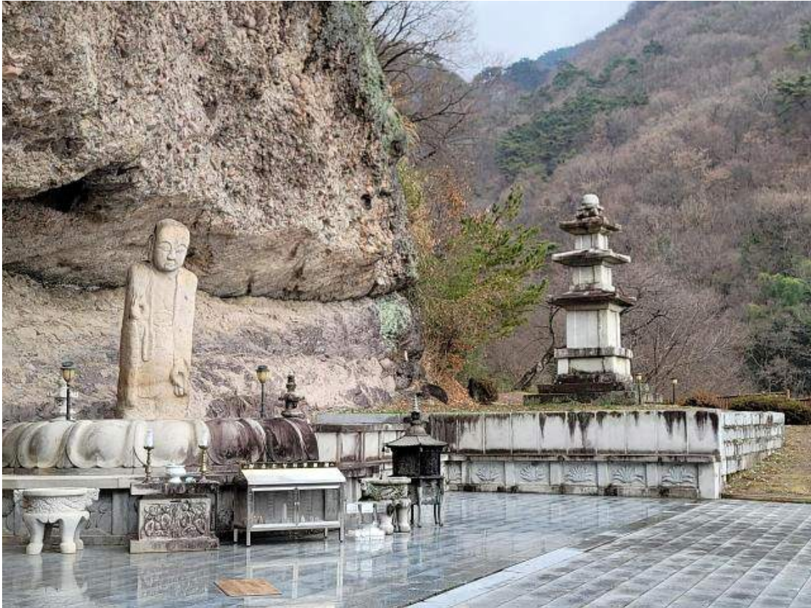
고려시대에 조성된 오층석탑과 지장보살상이 서있는 연동사 노천법당.

금성산성에서 의병과 왜군 사이에 치열한 전투가 벌어졌던 정유재란(1597) 이후 400년 동안 연동사는 폐허로 남아 있었다. 산죽(山竹)과 잡초가 무성하던 절터에 1990년대 초에 20대 후반의 젊은 승려가 찾아왔다. 그는 절터 위쪽의 동굴(지금의 동굴법당)에서 생식을 하면서 수도를 시작했다. ‘금성산성 화산암군’ 국가지질공원으로 지정된 연동사 절터에는 동굴이 여러 개 있다. 밑이 움푹 파인 거대한 암벽 앞 평평한 곳에 지장보살이 반쯤 묻혀 있었다. 노천법당 주변에도 무너진 석탑의 부재(部材)들이 여기저기 흩어져 있었다. 그는 동굴 수도를 하면서 연동사 복원을 평생 과업으로 삼아야 하겠다는 결심을 굳혔다.