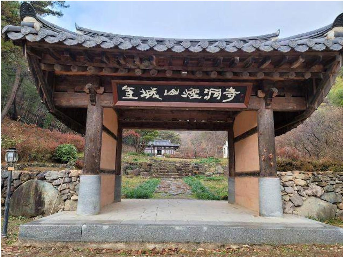
연동사 일주문을 통해 극락보전이 보인다.

절의 종이 술을 담가서 거의 익을 때쯤 되면 누가 감쪽같이 훔쳐 마셨다. 종이 이영간을 의심하여 두세 번 종아리를 때렸다. 이영간이 몰래 엿보니 늙은 살랭이가 와서 훔쳐 마셨다. 이영간이 잡아서 죽이려 하자 살랭이가 살려 달라고 애원하면서 "네가 만일 나를 놓아주면 평생 유용하게 쓰일 신기한 술법(術法) 책을 주겠다" 하였다. 때마침 청의 동자(靑衣童子)가 나타난 권의 책을 던져주므로 이영간이 그 살랭이를 놓아주었다. 그리하여 그 책을 간직하여 두었는데 나중에 장성하여 벼슬을 하매 이영간이 하는 모든 일이 보통과 달랐다.