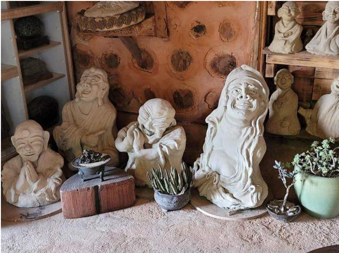
원행이 눈흙을 가져다 빚은 215 나한상.

원행 스님은 찰진 눈흙을 가져다가 516명의 나한상을 만드는 작업을 했다. 아라한은 범어 아라하트(arahat)의 음역으로 보통 줄여 '나한'이라고 한다. 16 나한은 부처의 경지에 오른 제자들이고, 500 나한은 역시 부처의 경지에 오른 수행자를 지칭한다. 원행은 나한상을 250 점 가량 만들어놓았는데 똑같이 생긴 나한이 한 점도 없다. 그러나 나한상만 만들고 미처 굽지 않은 상태에서 원행이 젊은 나이에 홀연히 세상을 떠났다.