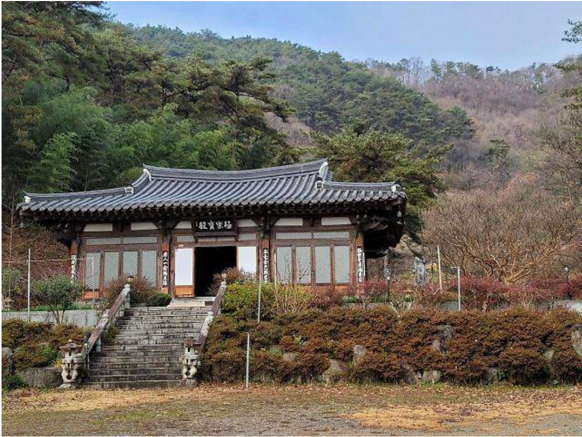
연동사 극락보전. 경관이 뛰어나고 조경도 잘돼 있다.

해우소도 원행이 직접 지었다. 자연과 단순함을 추구하는 승려의 미적 감각이 반영돼 있다. 통나무 자갈 기와로 벽을 만들어 벽화 같은 분위기를 자아낸다. 화장실 내부가 깨끗했고 맹종죽 숲의 댓잎 서걱이는 소리가 배경음악으로 들려왔다.