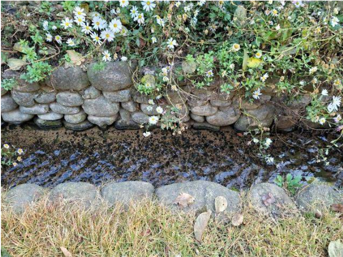
돌담길 옆으로는 맑은 실개울이 흐르고 구절초가 피어 있다. 다.

마을의 돌담은 총연장 3.6km. 맨 아래에는 큰 돌로 중심을 잡아 물에 파이거나 씻겨 내려가지 않게 기반을 다지고, 올라갈수록 점차 작은 돌을 써 맨 위에 기왓장을 올렸다. 돌담에 쌓은 돌은 인근의 산이나 개울에서 가져온 잡석들이지만 삼지내 담벼락에서 만나 조화로운 아름다움을 표현한다.