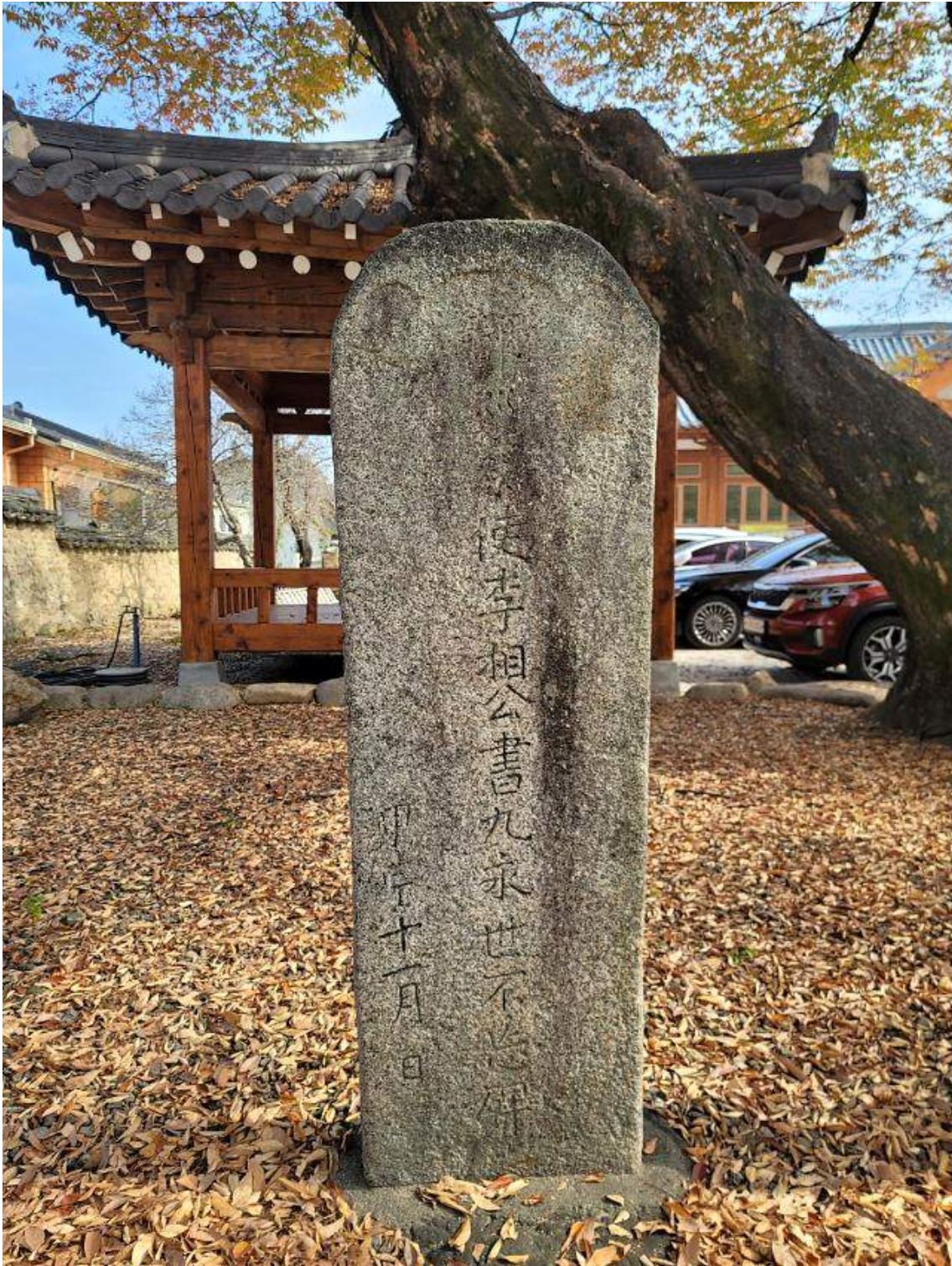
창평현청 앞에 서 있는 전라도 관찰사 이서구의 선정비.