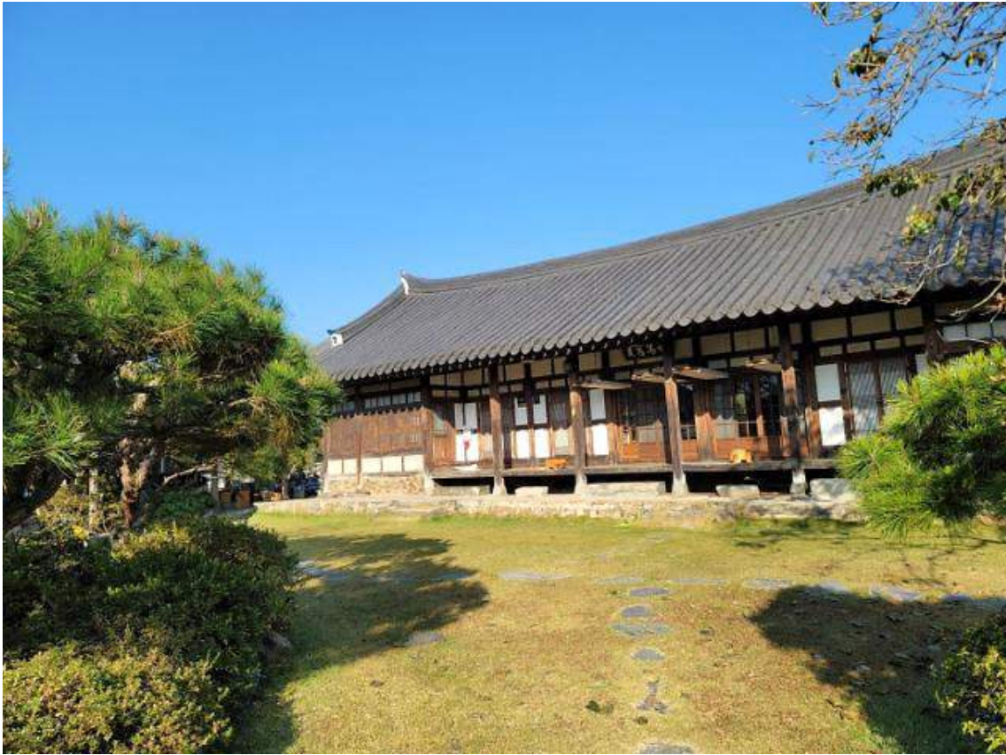
1920년대 지은 고향신 가옥은 민박집 '한옥에서' 안에 있다.

필자는 문화체육관광부가 90년 이상 된 한옥 숙박시설에 주는 '명품고택' 인증을 받은 '한옥에서'라는 민박 집에서 3박을 했다. 고택에는 임진왜란 때 의병장인 재봉(霽峰) 고경명(高敬命·1533~1592) 장군의 필적인 世篤忠貞(세독충정) 편액이 걸려 있다. 인간이 세상을 살아감에서 나라에 충성하고 항상 올바른 마음을 굳게 지녀야 한다는 뜻이다. 세독충정 원본은 고경명 장군의 사당인 포충사에 보존돼 있다.