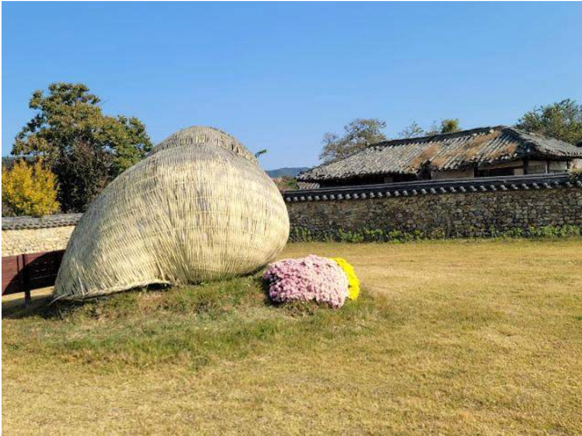
고정주 고택 앞에는 슬로시티의 상징물 달팽이가 대나무로 조립돼 있다.

춘강(春崗) 고정주(高鼎柱·1863~1933) 고택은 ‘ㄷ’ 자형 건물. 안채는 정면 7칸, 측면 3칸, 팔작지붕에 3칸 솟을대문이다. 춘강이 호남 지역 근대교육의 효시인 영학숙과 창흥의숙을 세워 국가의栋梁(棟梁)이 된 인재들을 배출했다는 점에서 근대사적 의미가 있다. 고정주 가옥 옆 공원에는 슬로시티의 상징물인 달팽이가 대나무로 조립돼 있다.