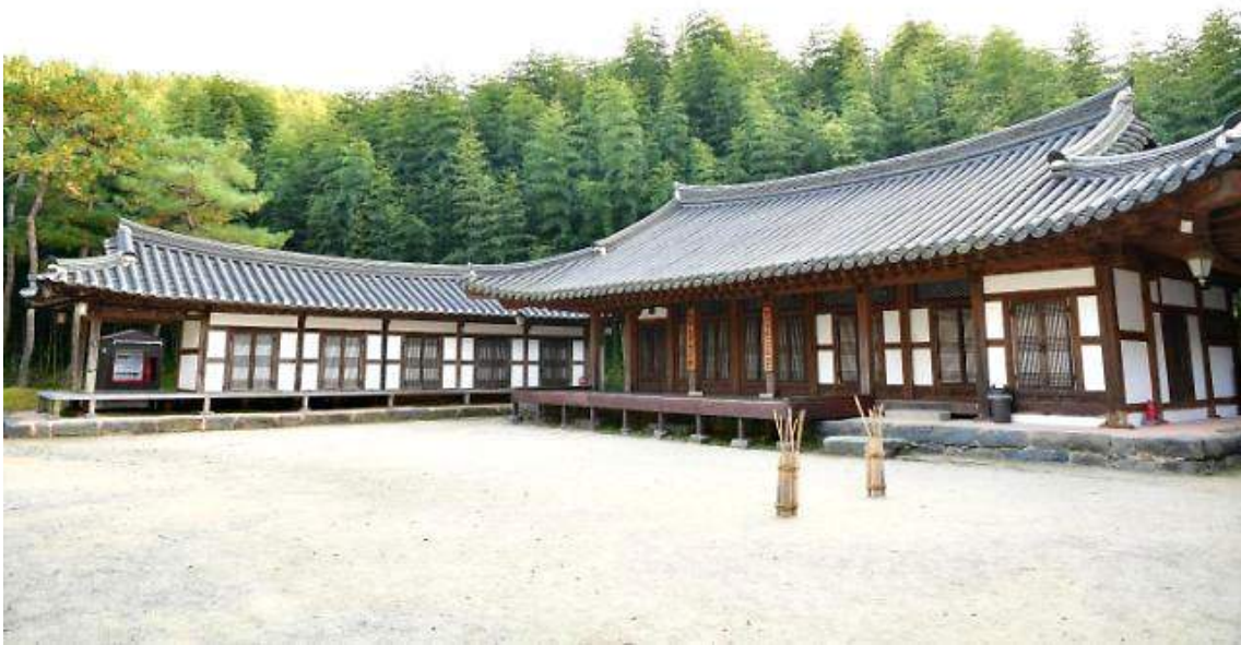
1920년대 지은 만석꾼 국채옹의 사랑채가 무너질 위기에서 2004년 죽녹원으로 옮겨 복원됐다. 건물 가운데에 있는 실내 무대에서 박동실 명창이 서편제를 공연했다.

그러나 담양에 오천석꾼이 200명이 넘었다는 《한국의 발견》 통계는 다소 부풀려진 것 같다. 1930년대 총독부 자료를 보면 조선인으로 천석꾼이 757명, 만석꾼이 43명. 담양에만 오천석꾼이 200명 있었다는 이야기는 분명히 과장됐지만 담양의 재력을 배경으로 근대 교육을 통한 인재 양성과 의병 활동이 이루어지고 판소리나 서화, 음식 같은 문화가 발달할 수가 있었던 것은 부인할 수 없다.