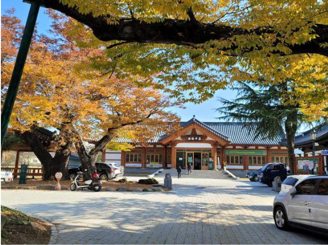
한옥으로 지은 창평 면사무소는 창평현청이라는 편액을 달고 있다.

2014년에 준공된 창평면사무소는 호남에서 유일하게 한옥으로 지은 면사무소다. 그런데 건물 어디에서도 면사무소라는 관청 이름을 찾아볼 수 없다. 이 멋진 한옥은 ‘昌平縣廳’(창평현청)이라는 편액을 달고 있다. 행정구역상 담양군에 속해 있지만 창평이 한 세기 전까지 별도의 군현이었음을 알려주는 자존심의 표현이다.